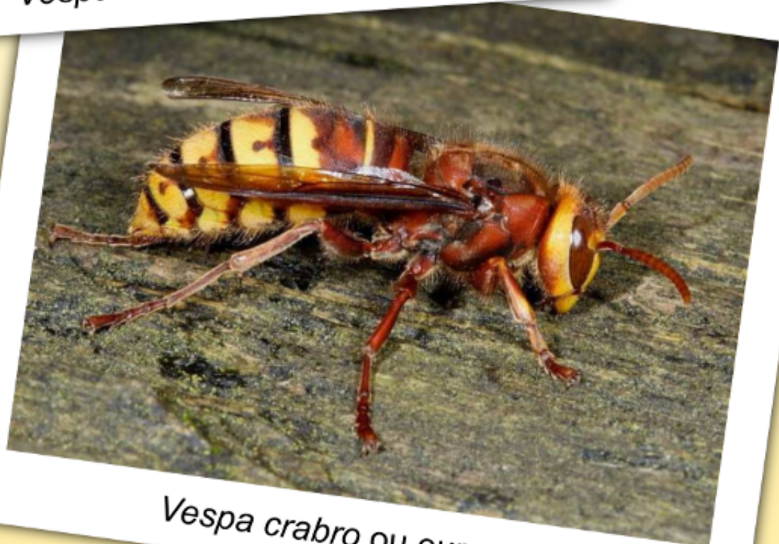
Vespa crabro ou europeia